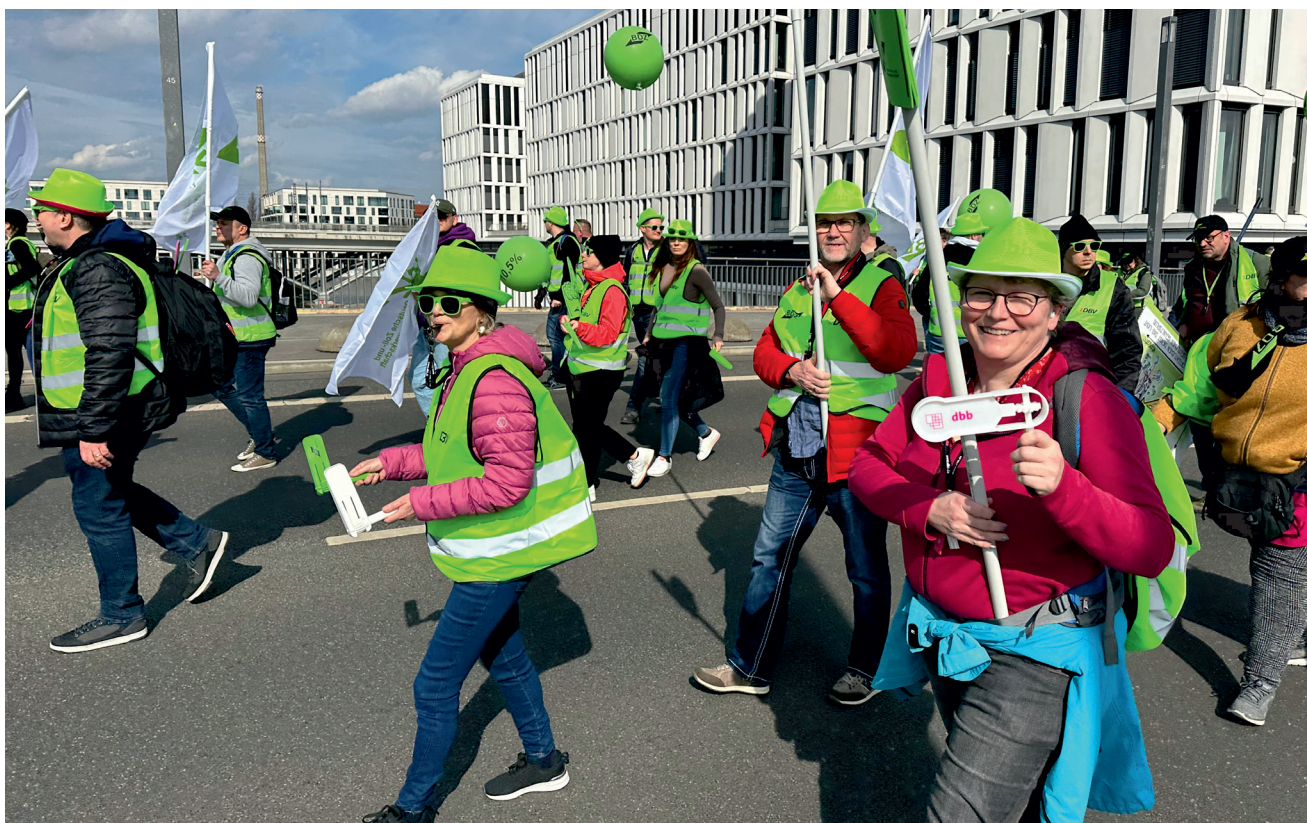
Der BV war auf der DEMO in Berlin im Rahmen der Tarifverhandlungen stark vertreten

BV Nürnberg (Nordbayern, Thüringen, Westsachsen) e.V. im BDZ Deutsche Zoll- und Finanzgewerkschaft